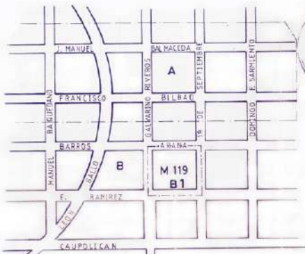
UBICACION ESC. 1:5000